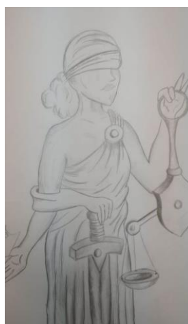
Заббаров Б. Р. Гр.1802