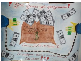
Зайцев О.Е. гр.19ПО2