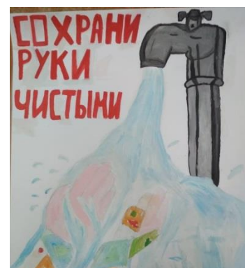
Геннатуллин Р.Р. Гр.1925