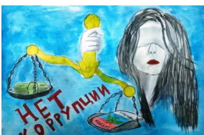
Никитин Р.В. гр.101.17